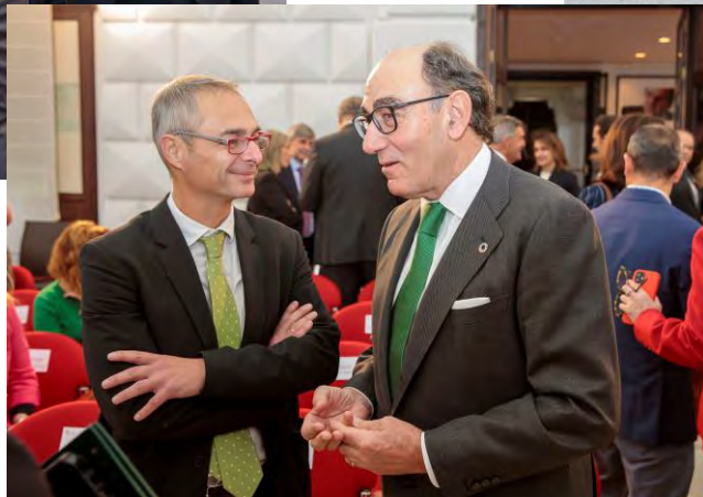
Acto de toma de posesión presidentes Consejos Sociales CYL (11/11/2022)